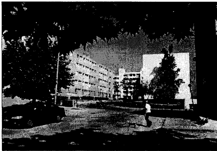
Écrire l'histoire du quartier à travers celle de ses habitants. Un joli projet pour lequel l'association "Récits" recherche des témoignages.

Ces histoires personnelles seront croisées avec "une histoire plus officielle, que l'on ressort des archives de la ville." Le but étant de "ra-